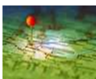
mappe interattive per "farvi trovare"