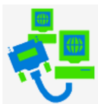
messaggistica e comunicazione

► Inoltre, di seguito sono esposte alcune delle potenzialità che possono essere integrate per implementare in rete il Vostro processo di comunicazione , e che il consulente MP-Progetti.it può sviluppare: